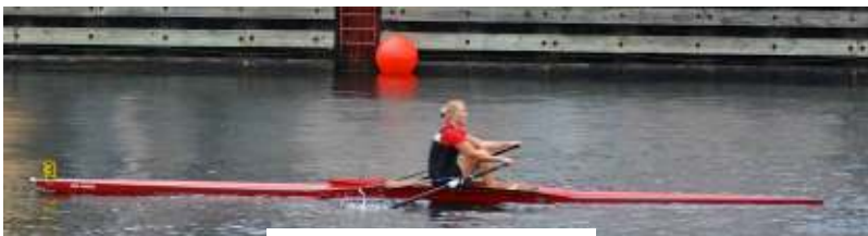
Amager Regatta 2014