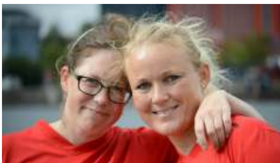
Flere højdepunkter fra Amager Regatta 2013

Vi takker REMA 1000, JYSK og Nordea samt alle de private for støtten til roklubbens støtteforening GAS. Vi er meget taknemmelige for alt hvad vi får.