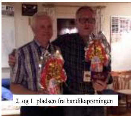
2. og 1. pladsen fra handikaproningen