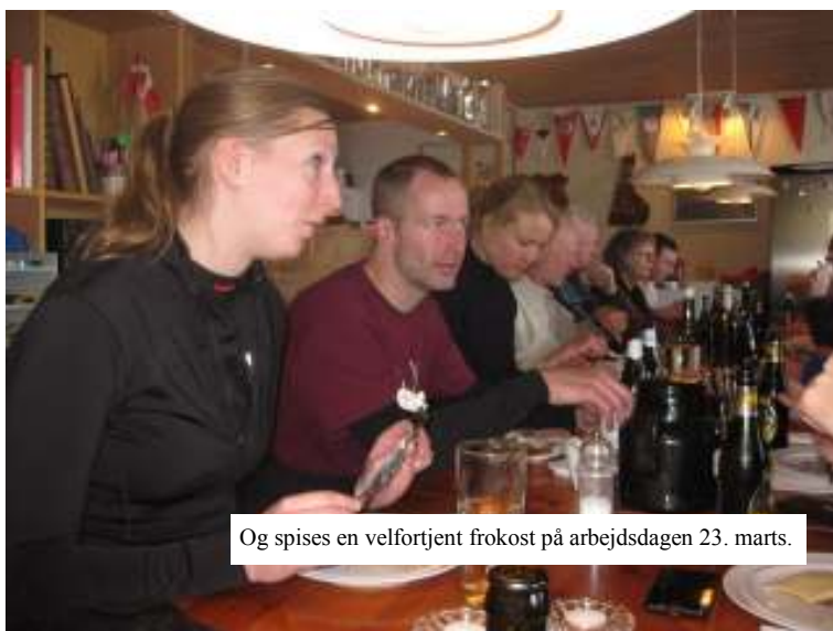
Og spises en velfortjent frokost på arbejdsdagen 23. marts.