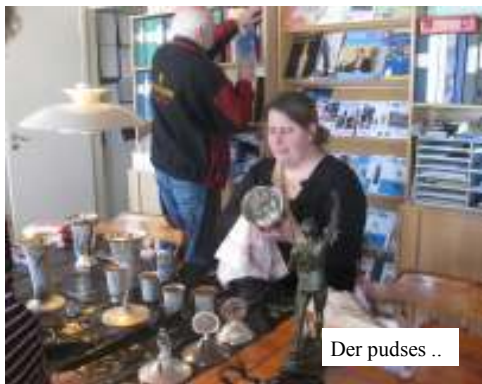
Der pudsses ..