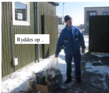
Ryddes op ..