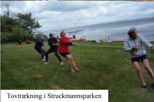
Tovtrækning i Struckmannsparken