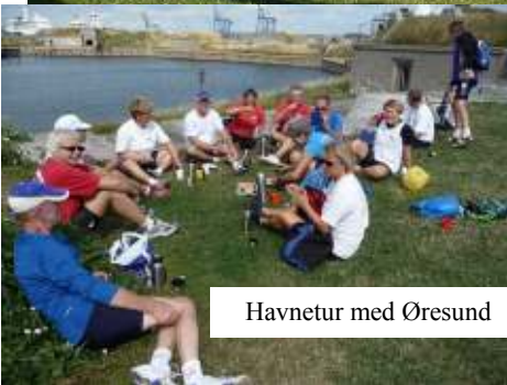
Havnetur med Øresund