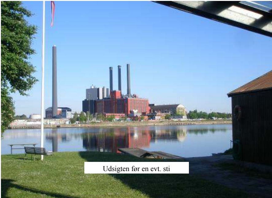
Udsigten før en evt. sti