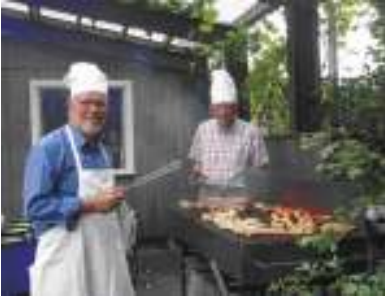
De gode grillmestre ved SAS Grill

Selvom mange er rigtig ”gamle” i klubben og har kendt hinanden i mange år, oplever man stor åbenhed og interesse for os nye.