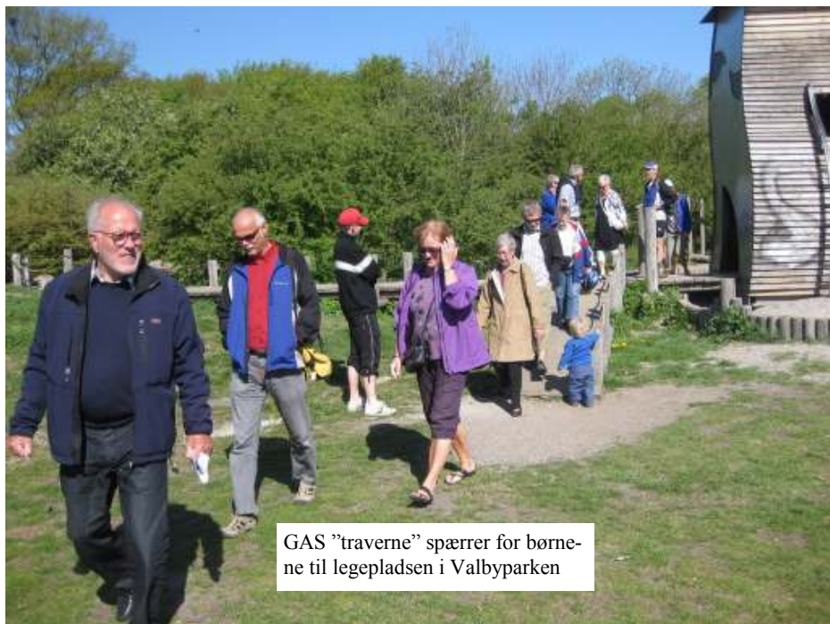
GAS "traverne" spærrer for børnene til legepladsen i Valbyparken