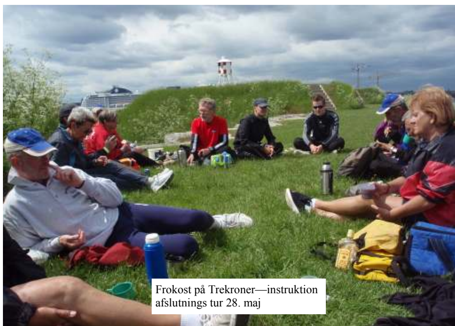
Frokost på Trekroner—instruktion afslutnings tur 28. maj