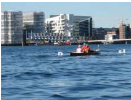
Billeder fra Amagerregattaen 2008