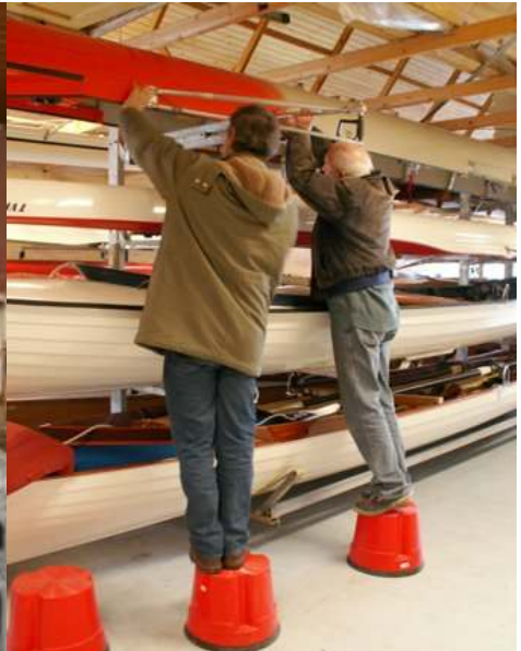
Billeder fra arbejds søndagen 2. april