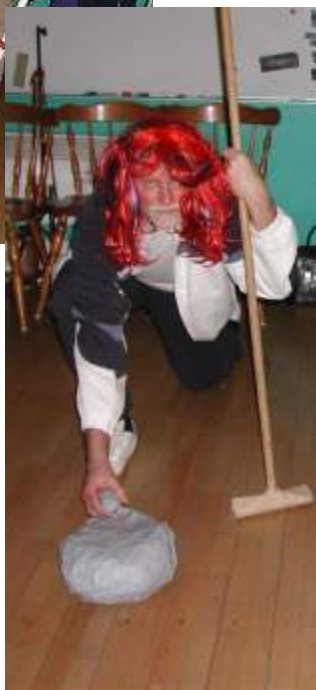
Billeder fra KM-jager festen i Roklubben